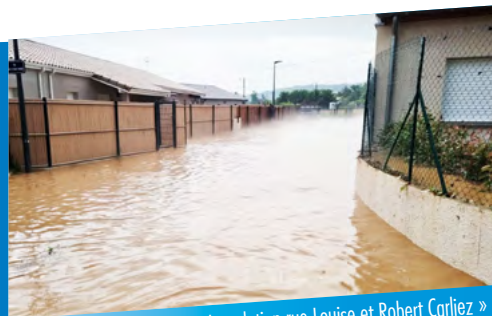
« Inondation rue Louise et Robert Carliez »