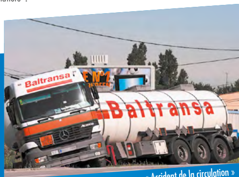
« Accident de la circulation »

En fonction des quantités transportées, la réglementation impose que chaque chargement soit identifié par des plaques oranges réfléchissantes affichant les codes "danger" et de "matière".