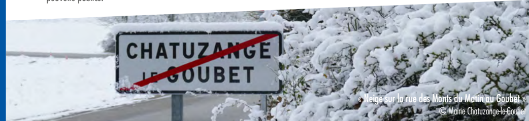
« Neige sur la rue des Monts du Matin au Goubet »

NIVEAU 4 : Une vigilance absolue s'impose. Des phénomènes dangereux d'intensité exceptionnelle sont prévus. Tenez-vous régulièrement au courant de l'évolution de la situation et respectez impérativement les consignes de sécurité émises par les pouvoirs publics.