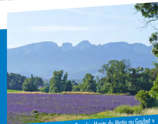
« Rue des Monts du Matin au Goubet »